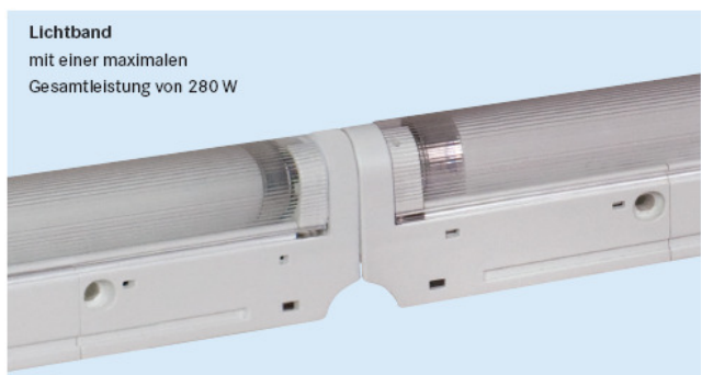
Lichtband mit einer maximalen Gesamtleistung von 280 W