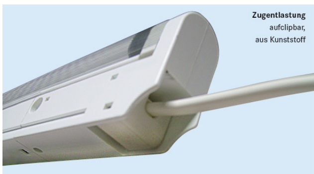
Zugentlastung aufclipbar, aus Kunststoff