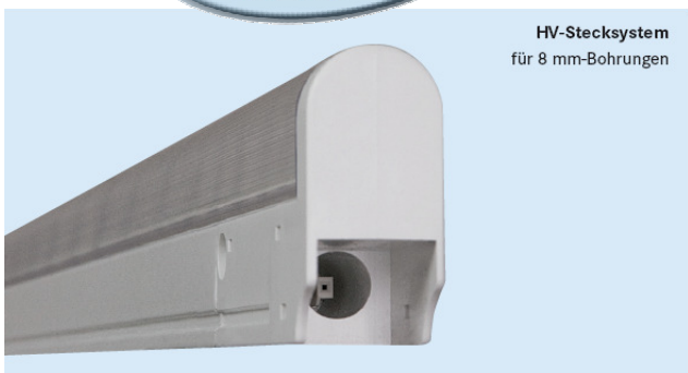
HV-Stecksystem für 8 mm-Bohrungen